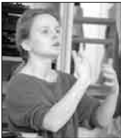
Sháním štafle, nemusí být moc vysoké. Zn.: Neumím tančit na špičkách.