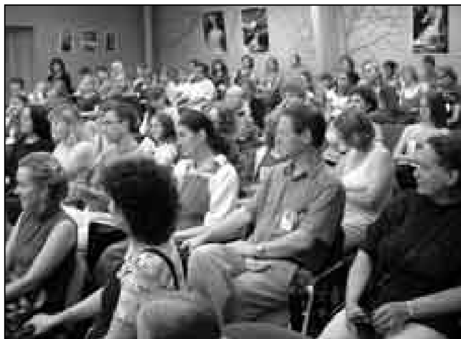
záběr do hlediště auly Střední lesnické školy