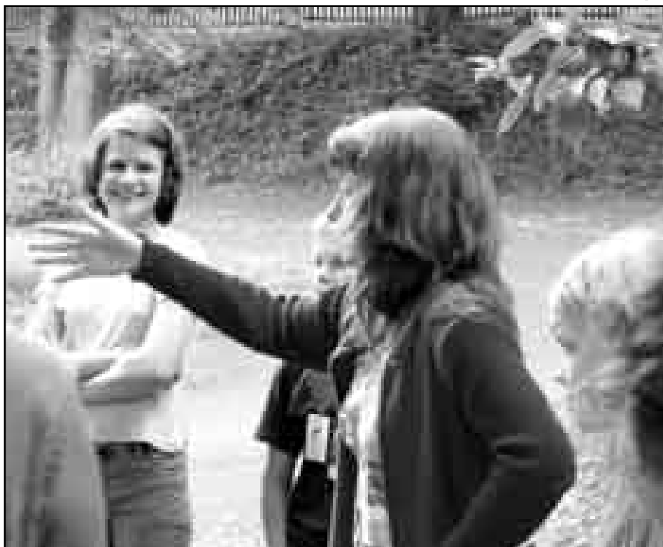
poetické setkání recitátorů III. kategorie v parku