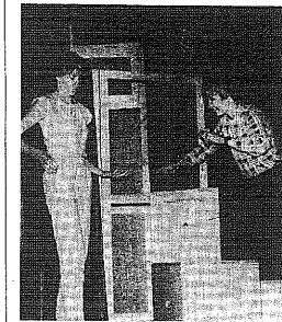
TRINÁCTKA PRO OSMÍCKY

je nejen titul jedné ze tří slavných sbírek veršů pro děti, které koncem minulého století napsal J. V. Sládek, ale také název časopisu o dětské literatuře. U jeho zrodu v roce 1957 stál František Hrubín a řada dalších osobností dětské literatury, české literární kritiky a historie a české publicistiky. Kromě historických a kritických studií o naší i zahraniční (to už měně) literatuře pro děti má pravidelnou a obsáhlou recenzní rubriku, v níž lze vcelku dobře sledovat, co nového vychází pro děti v Praze o Bratislavě i v krajších nakladatelstvích. Ačkoliv je časopisem literárněkritickým, věnuje část místa také jiným oblastem umění pro děti (včetně loutkového divadla) a rovněž dramatické výchově dětí. Vydává ho desetkrát do roka nakladatelství Albatros v Praze.