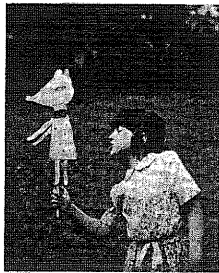
TAKHLÉ ZAČÍNÁ SOUTBOUR, KTERÝ LONI VYSTOUPIL V KAPLICI S PORADEM TRINÁCTKA PRO OSMÍCKY

Co dnešní děti nejvíce potřebují? Mnohem