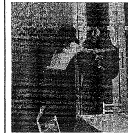
HUDRADLO ZLIV — BERCIVS