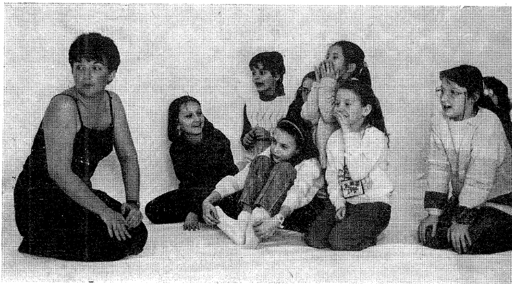
E. ČARSKÁ S DEŤMI

Jedného dňa šla Taffy s otcom chytat ryby. Otcovi sa zlomil oštep a Taffy prišla na myšlienku, že pošle po cudzincovi, ktorý práve prechádzal okolo, odkaz mame, aby poslala nový oštep. Ale keďže Taffy nevedela písať, nakreslila odkaz žraločím zubom na kôru brezy.